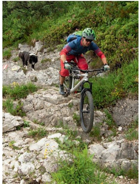
Bei der MTB-Abfahrt vom Fellhorn ist gute Technik gefragt