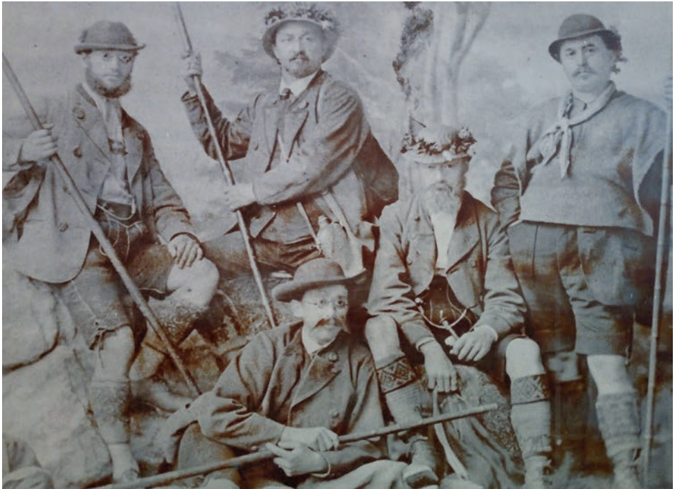
Die Gründerväter 1873

ziger Riß, der den ganzen Coloß in zwei Theile zu spalten scheint, gestaltet den Aufstieg, welcher schornsteinfegerartig zugleich mit Händen und Füßen, Knien und Armen ausgeführt werden muß. Großen Vorrtheil gewährt ohne Zweifel bei dieser Passage ein Seil.