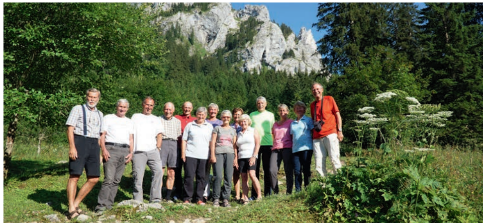
3-Tages-Ausflug im Ammergebirge