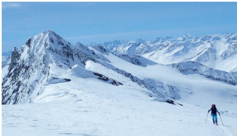
Aufstieg zur westl. Simonyspitze

Im September 2013 wurde die Grauspitze in Liechtenstein bestiegen. 2014 sollten Gran Paradiso, Montblanc und Triglav folgen. Aufgrund der unbeständigen Witterung sowohl an Ostern als auch im September wurden jeweils Ersatzfahrten in die Dolomiten bzw. zum Gardasee durchgeführt. 2015 konnte der Gran Paradiso mit Ski bestiegen werden, 2016 endlich der Triglav im Sommer als Überschreitung. Ostern 2017 war die Hochtourengruppe bei der Skibesteigung der Dufourspitze erfolgreich. Im Herbst 2018 konnte die Besteigung der Zugspitze über den Jubiläumsglat auch beim zweiten Versuch wegen des schlechten Wetters nicht durchgeführt werden.