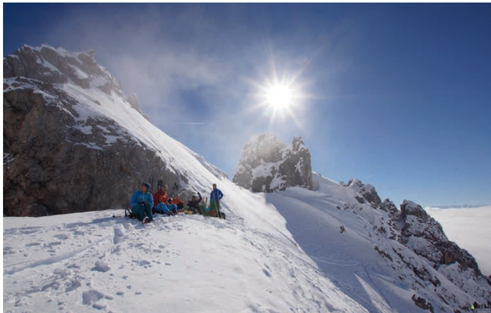
Auf die Taghaubenscharte vom Dientner Sattel