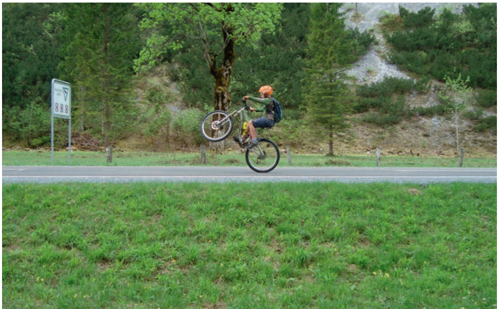
Die Jugend auf der Röthelmoosrunde