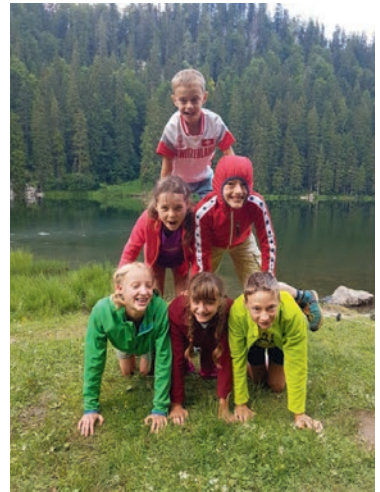
Lebende Pyramide am Taubensee