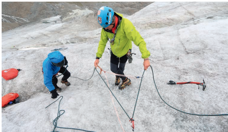
Spaltenbergung beim Eiskurs am Taschachhaus