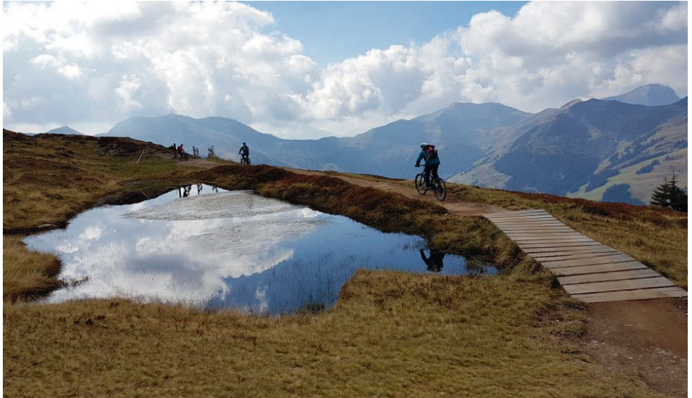
Trail-Zauber vom Schattberg-West in Saalbach