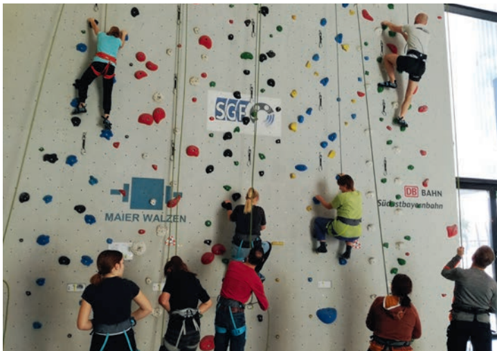
Topropekletterkurs für Anfänger in der Kletterhalle Waldkraiburg