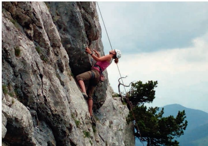
Klettern am Wildalpjoch