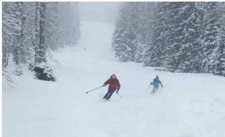
Traumhafte Pulverabfahrt bei Watzmannuglwetter