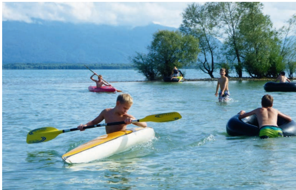
Kinderfreizeit in Schützing am Chiemsee