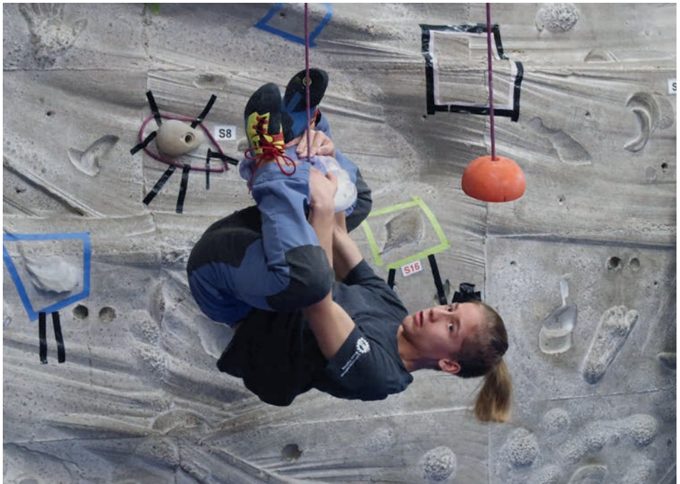
Spannende Boulder waren zu meistern