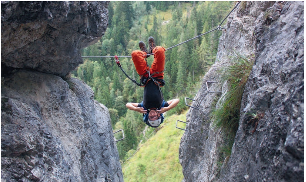
Akrobatik am Grünsteinklettersteig

Anmeldung mindestens 3 Wochen vorher wegen der Übernachtungsreservierung!!