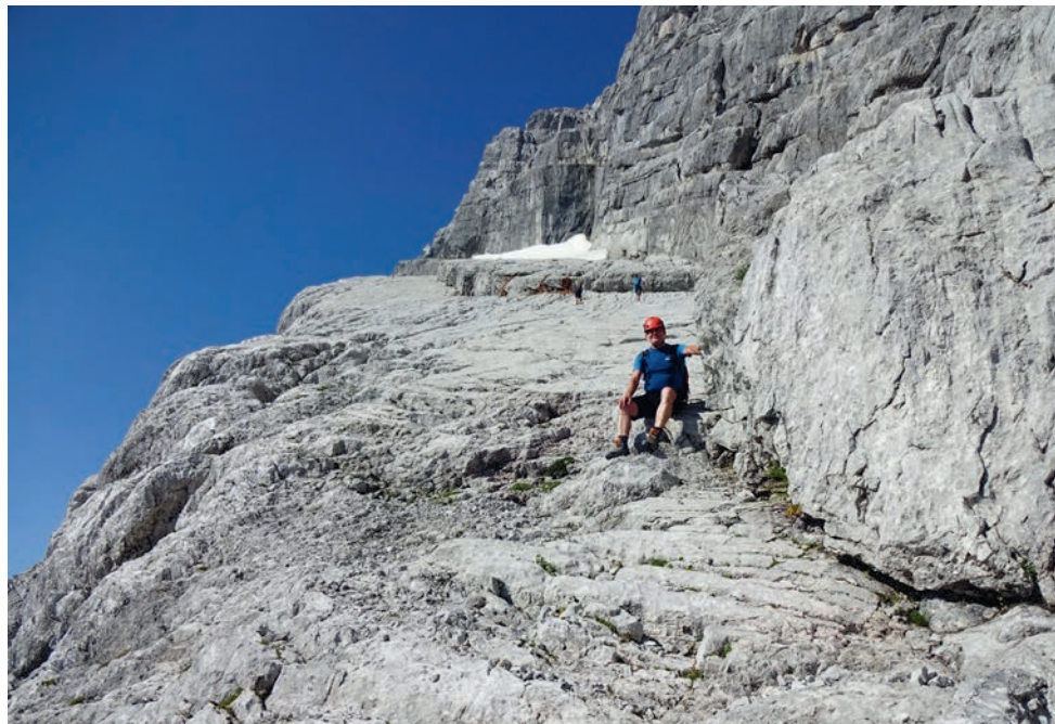
Auf dem Wiederband