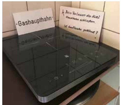
„Erbauerzeit – Gegenwart“