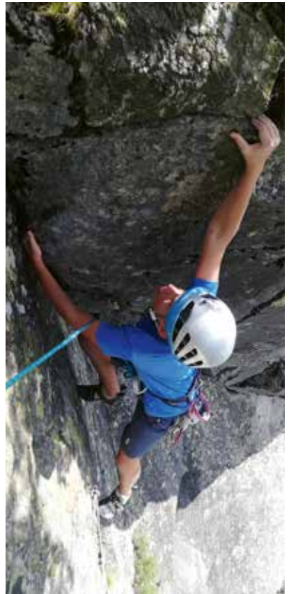
Mehrseillängentour im Zillertal