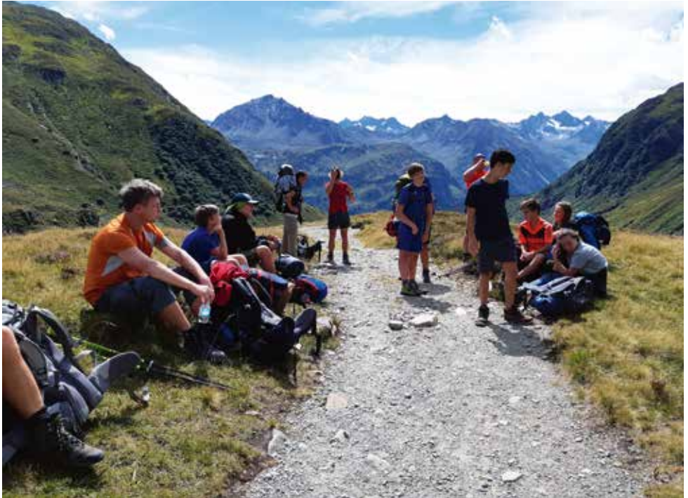
Familien unterwegs rund um die Heilbronner Hütte