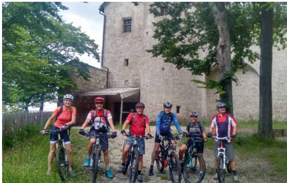
MTB-Ausfahrt zur Steiner Burg