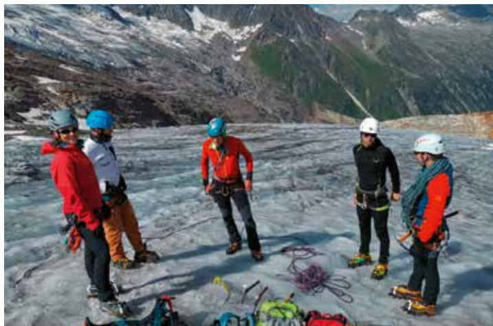
Eiskurs auf der Warnsdorfer Hütte