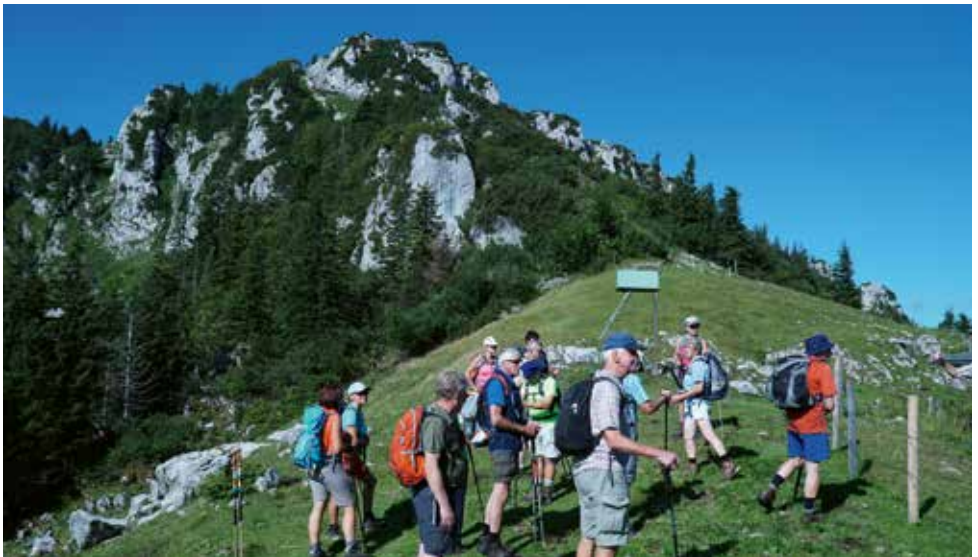
Unterwegs zu den Mehlbeerwänden im Kampenwandgebiet