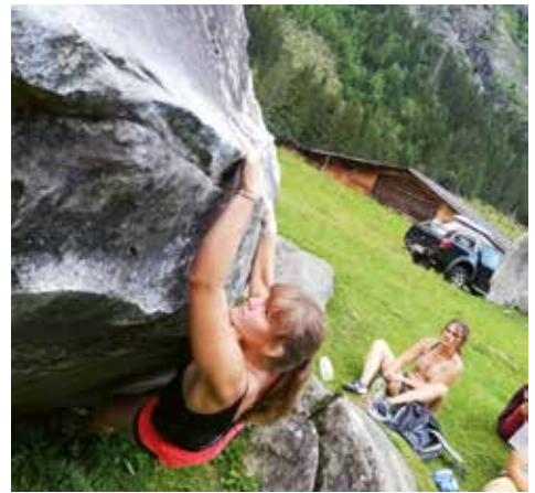
Bouldern im Zillertal – hier ist Maximalkraft gefordert

Bericht: Sabrina Kaiser