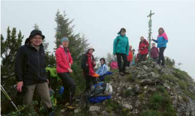
Zur Klausen, langsehnter Auftakt der Wandergruppe nach dem Lockdown