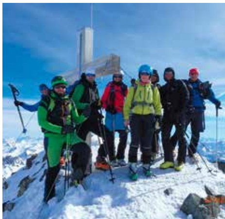
Die Hochtourengruppe auf dem Gipfel des Piz Buin