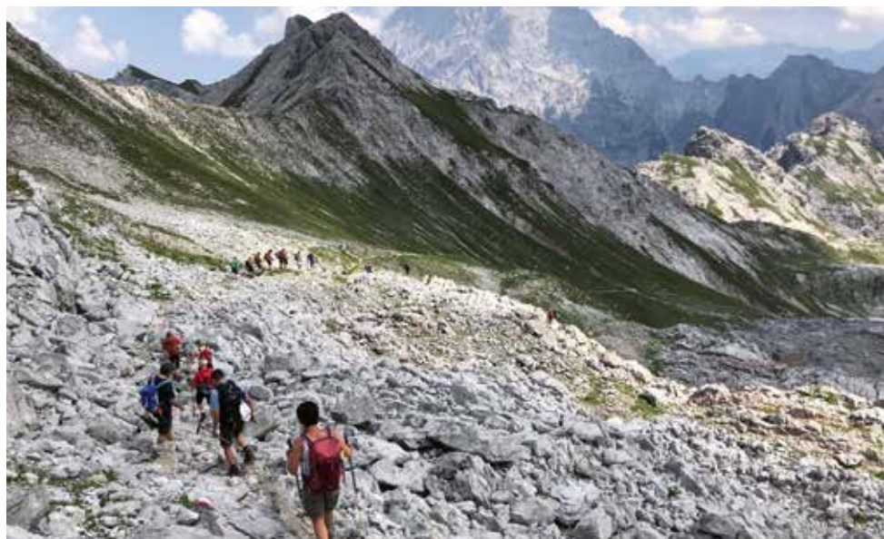
Konditionsstarke Senioren beim Abstieg vom Seehorn