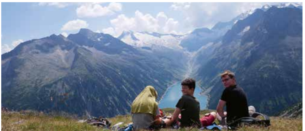
Hoch über dem Schlegeis-Speicher