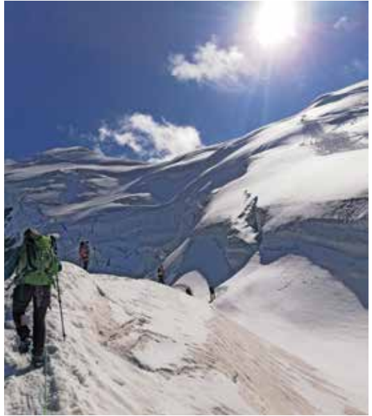
Die Jugend auf dem Weg zur Weissmies im Wallis