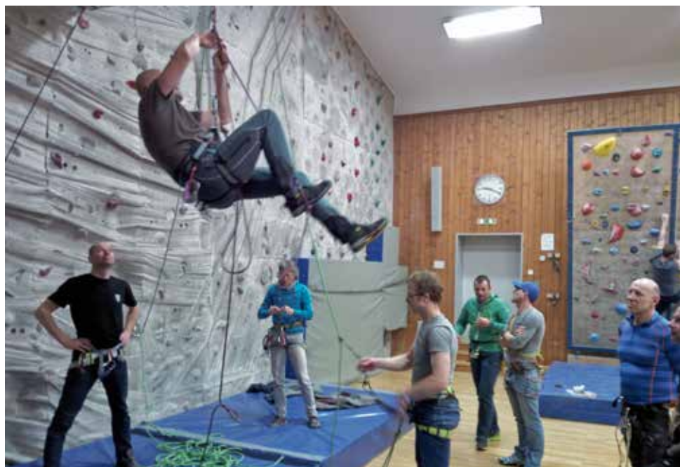
Spaltenbergungstrockenübung der Hochtourengruppe in der Turnhalle