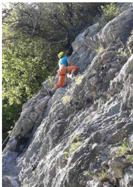
Herrliche Sportklettereien rund um Triest