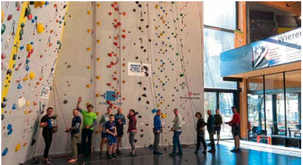
Kletterkurs Toprope in der Kletterhalle Waldkraiburg