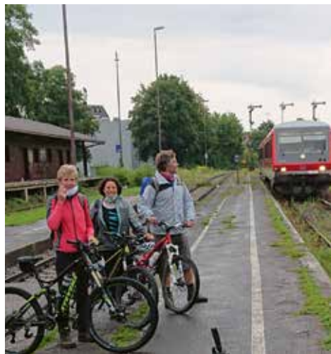
Hike & Bike auf den Zinnkopf, Anreise mit dem Zug