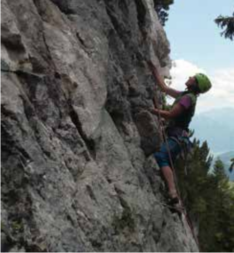
Kletterfahrt zur Kasererwand im Wendelsteingebiet