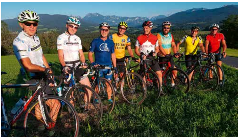
Rennradtour auf den Hochberg