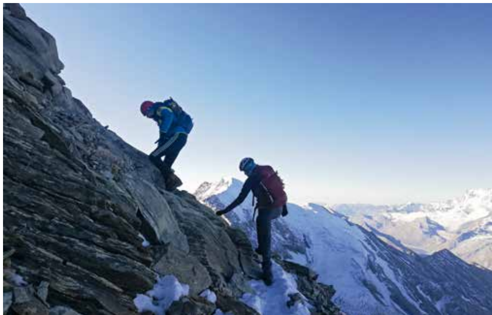
Hochtouren der Jugend auf Lagginhorn und Weissmies im Wallis