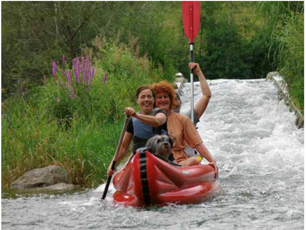
Lustige Bootsfahrt auf der Alz, traditionell nach dem AV-Grillen