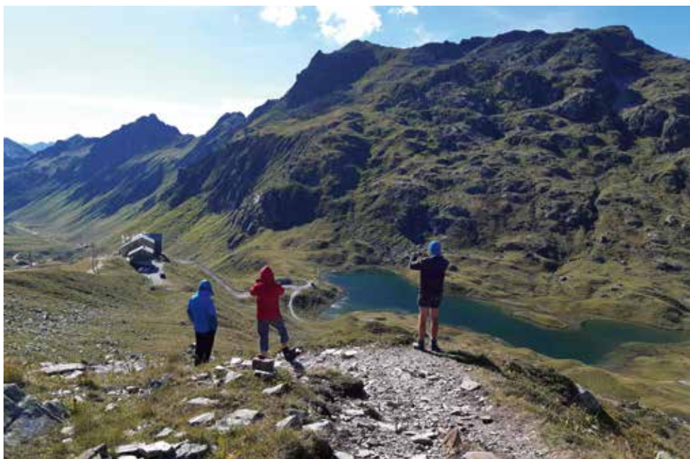
Erkundungen rund um die Heilbronner Hütte der Familien im Verwall