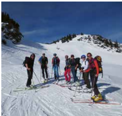
3-Gipfeltour: Jägerkamp, Tanzeck und Taubenstein im Spitzingseegebiet