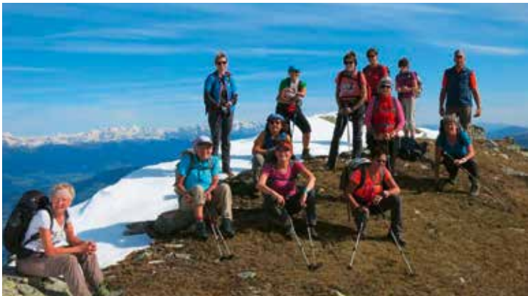
Über den Hundskopf auf die Königsangerspitze/ Brixen