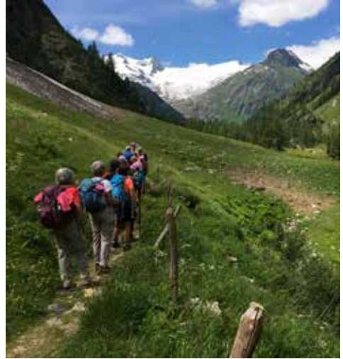
Die Seniorengruppe auf herrlichen Wegen im InnergschlöB