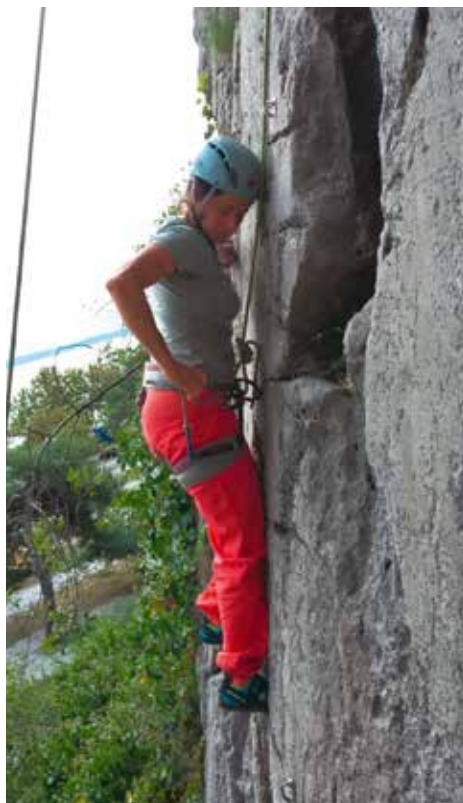
Klettern rund um Triest