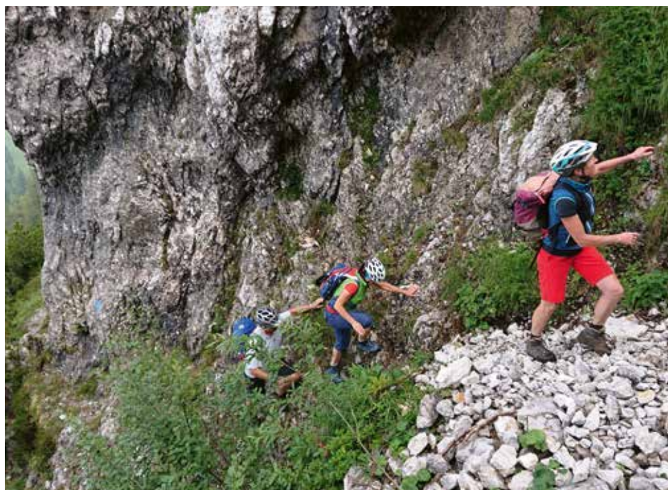
Kombinierte Zug-MTB-Tour auf die Hörndlwand