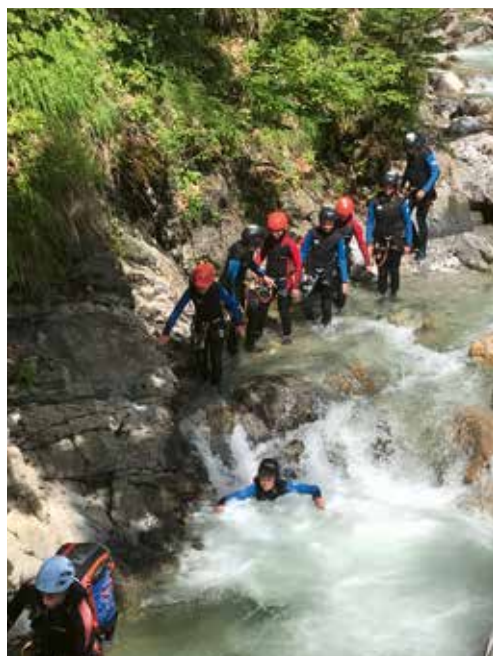
Spiel, Spaß und Abenteuer beim Familienwochenende in Weißbach bei Lofer