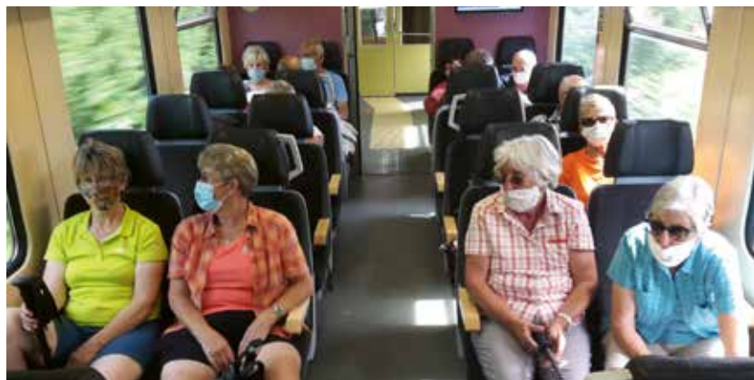
Die Senioren mit Zug und Bus zum Unternberg