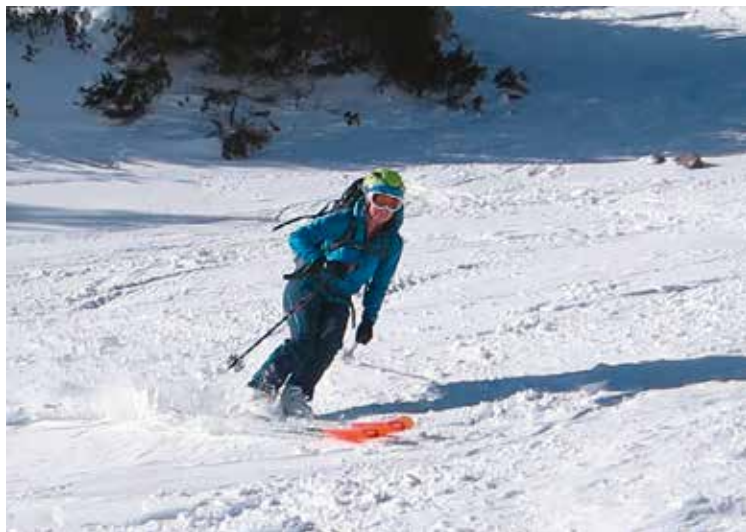
Abfahrt vom Tanzeck im Spitzingseegebiet