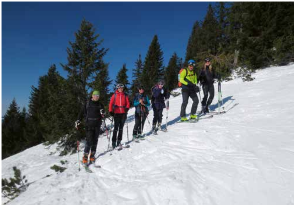
Skitour „Slowly slowly“ auf das Dürnbachhorn