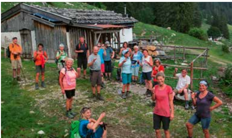
Mit den Mariannes von der Hochplatte auf die Kampenwand