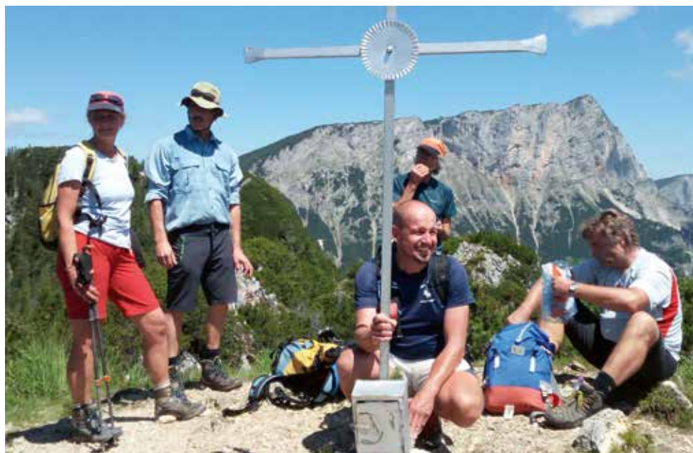
Mit der Bahn nach Bischofwiesen zur Überschreitung des Rauhen Kopfes