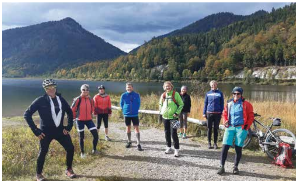
Röthelmoosradltour von der Haustüre weg, Rückfahrt mit dem Zug